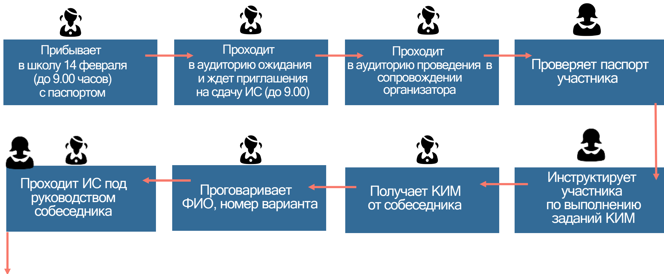
СХЕМА ПРОВЕДЕНИЯ ИС